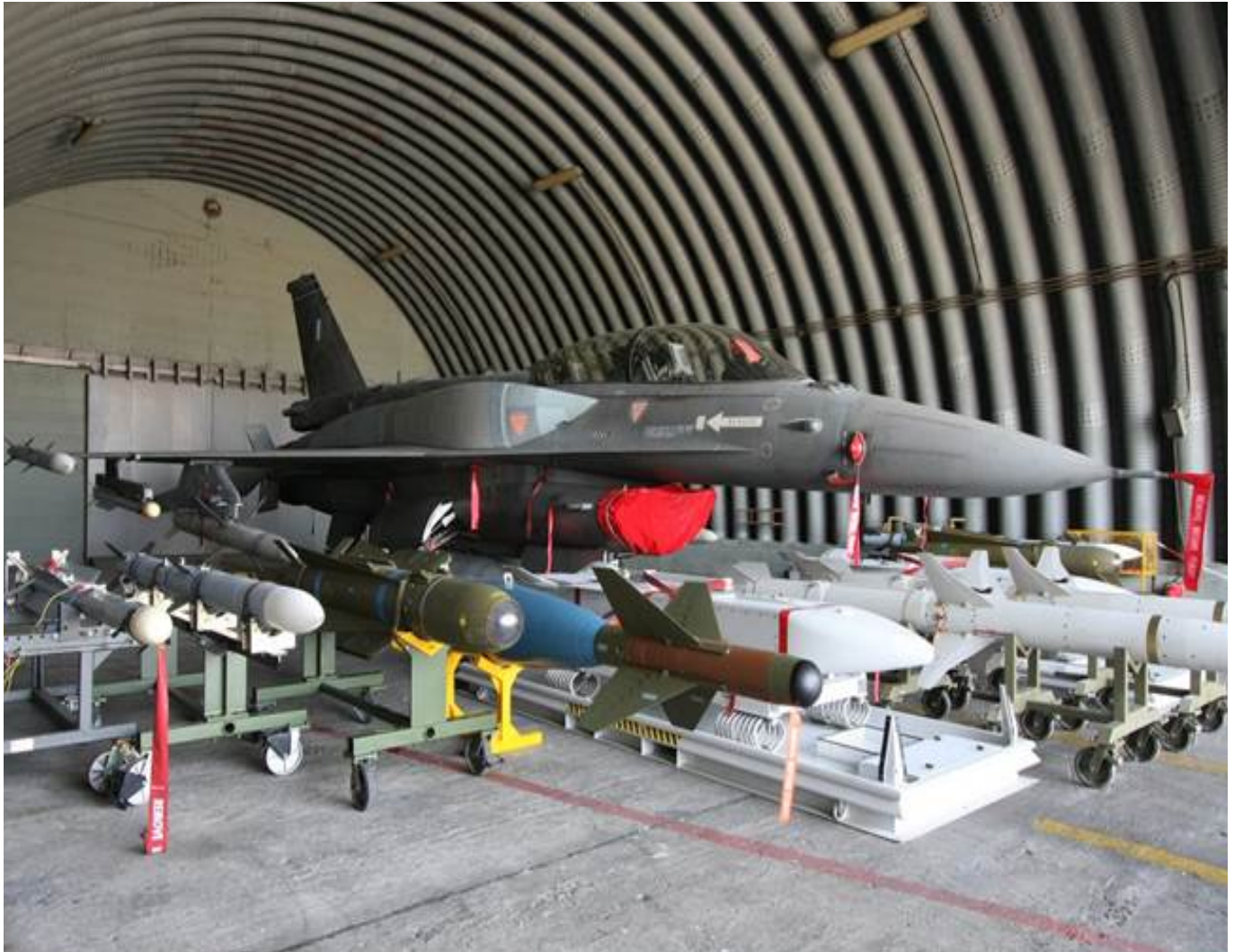
Ангари для зберігання військової техніки, Норвегія