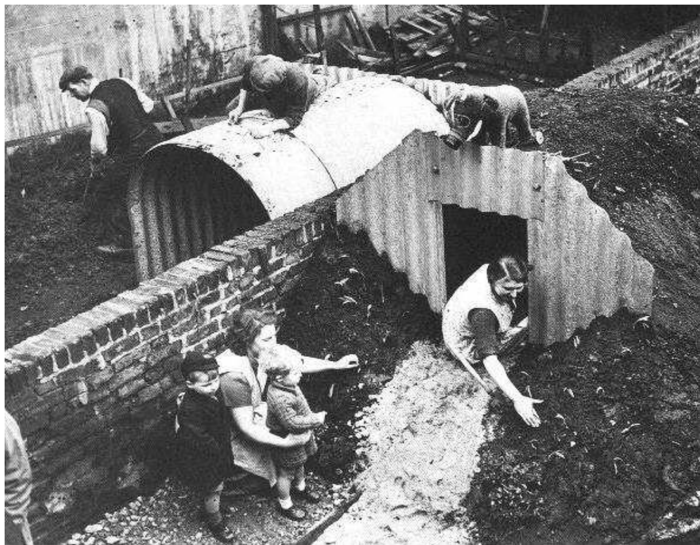
Британські «Укриття Андерсона» з гофрованої сталі